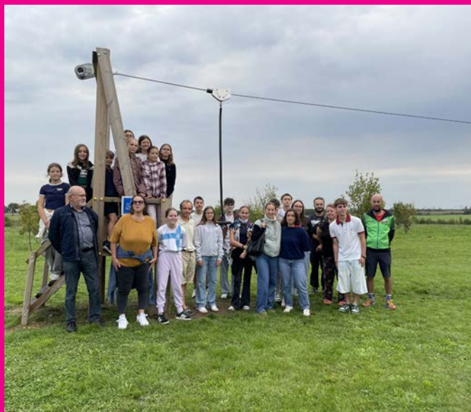
Inauguration de la tyrolienne et du parcours santé