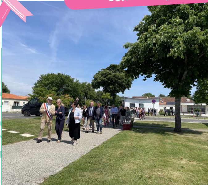
Inauguration du cœur de bourg