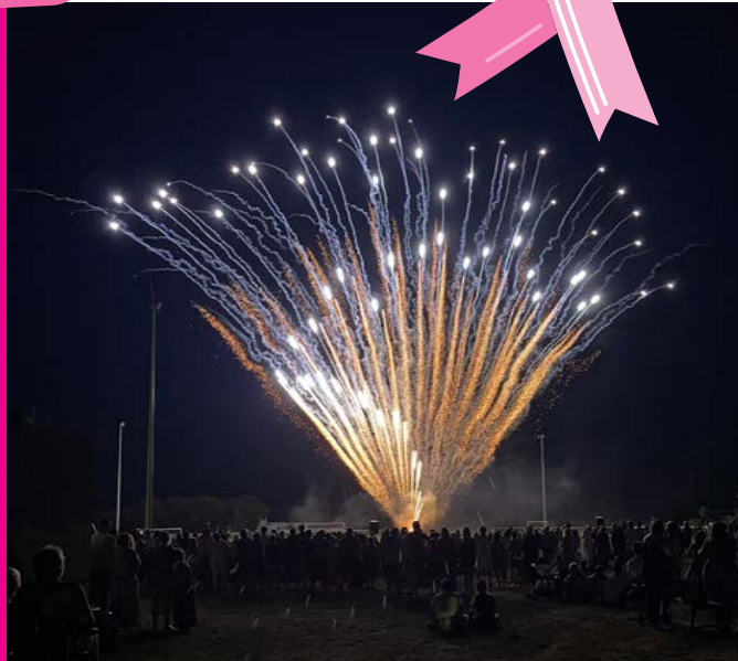
Feu d'artifice lors de la fête du village