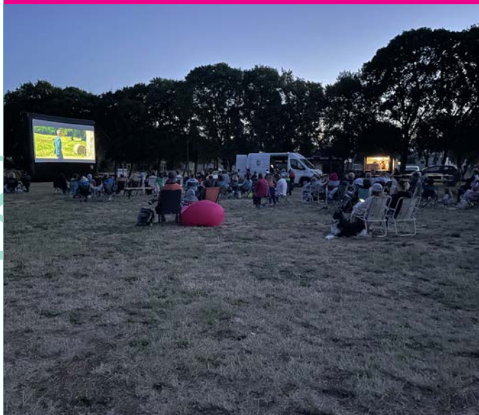
Cinéma en plein air